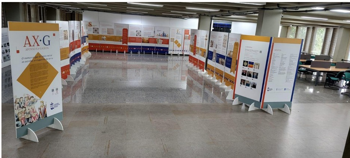
Espaço expositivo – 1º andar