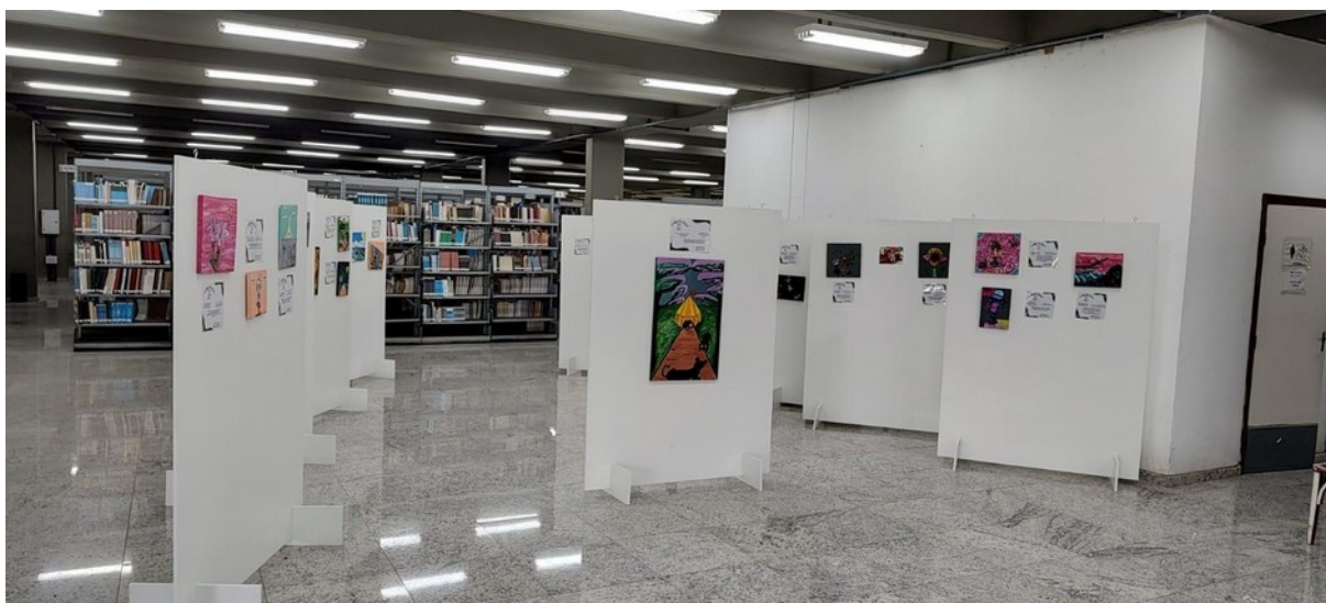
Espaço Expositivo – 2º andar.